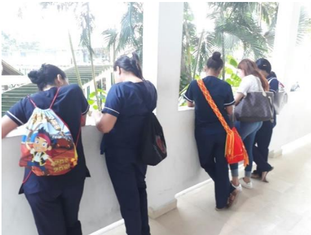
Anexo 3: Estudiantes de segundo semestre en el aplicativo de la prueba.