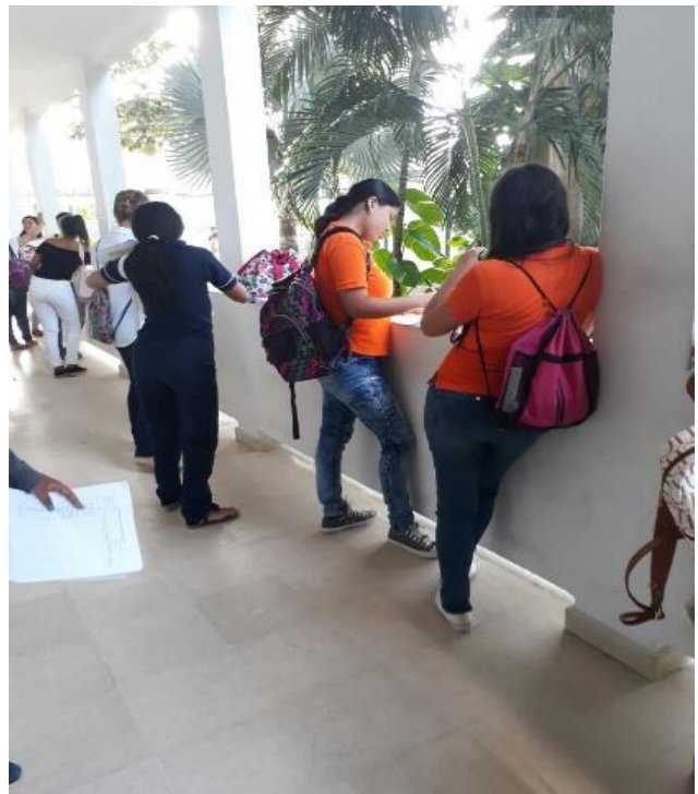
Anexo4: Estudiantes de segundo semestre realizando la prueba.