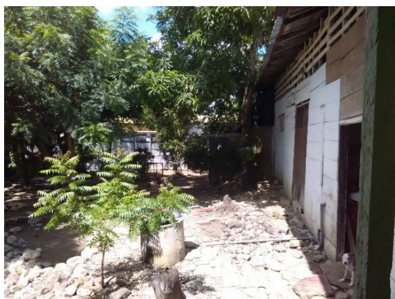
Figura 3. Fotografía Patio Casa Díaz Callejas.

Así mismo, escribió sobre Colosó con ímpetu y pasión, mostrando parte de la historia del municipio desde sus inicios, destacando la gestión política realizada y sus amistades que trabajaron por el bienestar del pueblo colosoano, en palabras de los habitantes, Díaz Callejas fue un hombre admirable, sencillo y con valores morales que le permitían tener buenas relaciones con la comunidad, en la actualidad la casa donde un día vivió es habitada por uno de sus sobrinos quien la habita con su familia, goza de una ubicación privilegiada al estar en la calle real (Calle principal del pueblo), de igual manera una de las casas más amplias y con jardín interno.