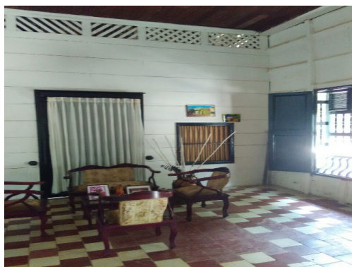
Figura 2. Foto Sala Casa Díaz Callejas.

Cada una de las edificaciones son de trascendental importancia para la comunidad, pues han pertenecido a familias y personajes destacados en el pueblo por su trabajo a nivel social, político y económico, es decir, que no solo son significativas por su belleza arquitectónica sino también por quienes un día las habitaron, un ejemplo de ello es la Casa Díaz Callejas, la cual fue habitada por Apolinar Díaz Callejas (1921-2010), abogado, historiador, escritor, periodista y político colombiano, nació en Palmito, aun así creció en Colosó, durante la presidencia de Carlos Lleras Restrepo (1966-1970) fue nombrado gobernador del recién creado Departamento de Sucre, fue elegido senador de la República de Colombia en 1970, además fue vicepresidente de la Asociación Internacional de Juristas Demócrata, por sus méritos, Díaz Callejas fue condecorado con la Orden del Congreso de Colombia en el grado de Gran Cruz con Placa de Oro; con la Orden Bernardo O'Higgins de la República de Chile, en el grado de Comendador, y con la Medalla del Sesquicentenario de la Universidad de Cartagena, tal como lo manifiesta, Escritores y Poetas Montemarianos (s/f).