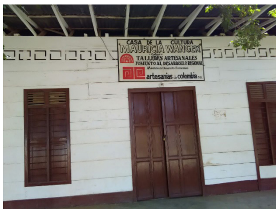
Figura 4. Casa de la cultura Mauricia Wanger