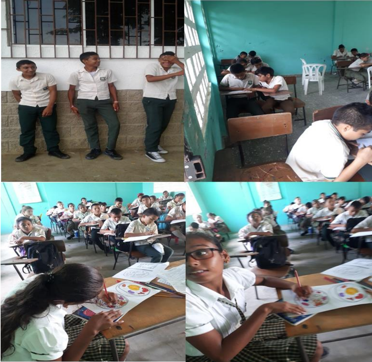
Jóvenes trabajando competencias