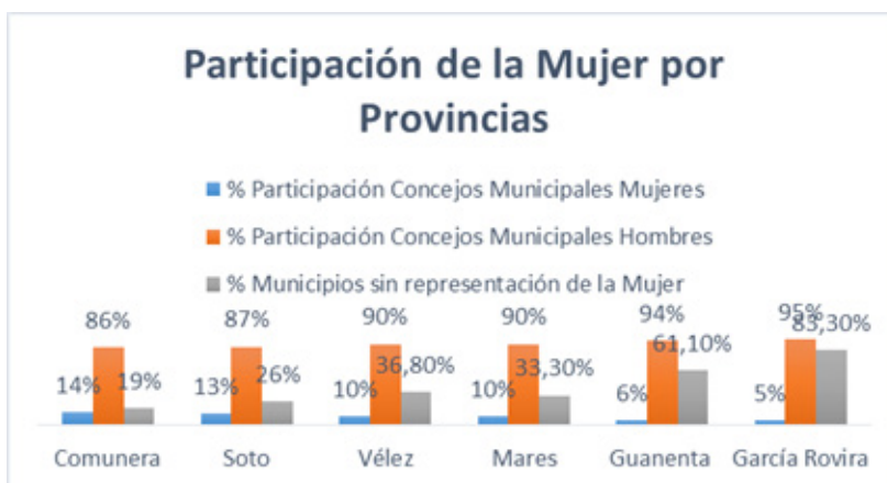
Gráfico 2. Participación de la mujer por provincias.

En la contienda electoral del período 2008-2011, a nivel de municipios, las mujeres alcanzaron representación en el 9.1%, en las alcaldías de 8 municipios. Mientras que en los Concejos Municipales lograron 82 curules de un total de 820. Lo que equivale al 10%, evidenciando un leve incremento en comparación con las elecciones anteriores. El panorama por provincias respecto de la participación de la mujer en los Concejos Municipales permite evidenciar que el porcentaje más alto se encuentra en un 14%, correspondiente a la provincia Comunera. Así mismo dos provincias se encuentran por debajo del 10%, como son la provincia de Guanentá con el 6%, y, García Rovira con el 5%.