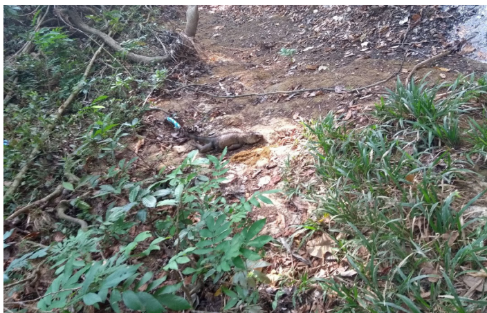
Iguana, fauna típica del sitio.

Por todo lo anterior, el Arroyo de San Basilio de Palenque es de una gran importancia para la comunidad, pues representa el centro de vida en la que se logra manifestar la cotidianidad cultural de los habitantes de este pueblo, ya sea como espacio recreativo, como comunicativo, de consulta y hasta de solución de conflictos.