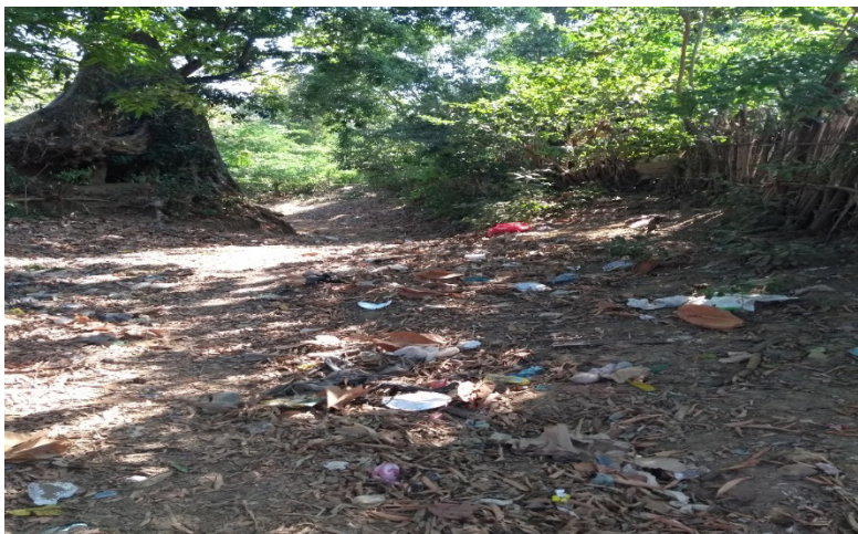
Entrada al Arroyo en el sector Caballito.

El daño, como lo indica Henao (1998) es la aminoración patrimonial –material e inmaterial– sufrida por la víctima, que puede ser tanto individual por la vulneración de los derechos subjetivos, así como respecto a los derechos colectivos. En materia ambiental es la afectación negativa relevante del ecosistema, los recursos naturales o el ambiente (Cafferatta, 2009) o como lo define el artículo 42 de la Ley 99 de 1993, la afectación del normal funcionamiento de los ecosistemas o de la renovabilidad de sus recursos y componentes.