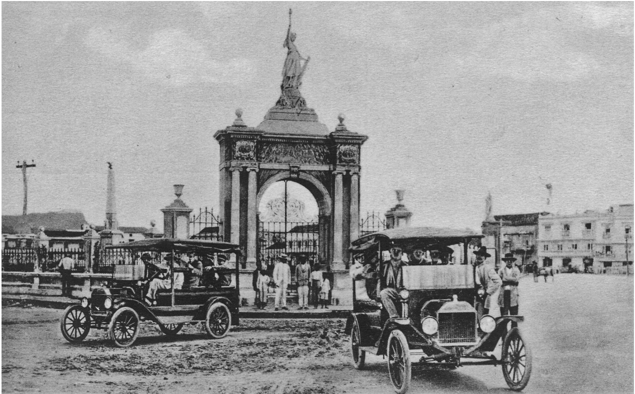
Imagen 4: Parque Centenario de Cartagena.