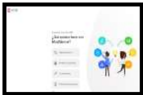
Imagen del programa Mind.creador.com