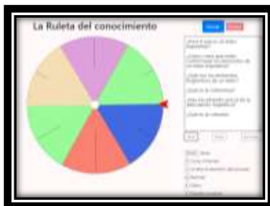
Imagen de la ruleta del conocimiento

Fuente: elaboración propia (Fotografía de la ruleta del conocimiento), https://es.piliapp.com/random/wheel .