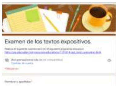
Imagen tomada del programa Formulario de Google