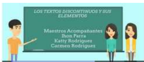
Imagen del video de los textos Discontinuos.