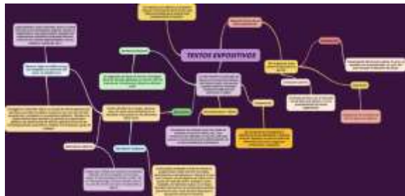
Imagen de un mapa mental del texto expositivo

Fuente: elaboración propia (Fotografía de un mapa mental sobre el texto expositivo)