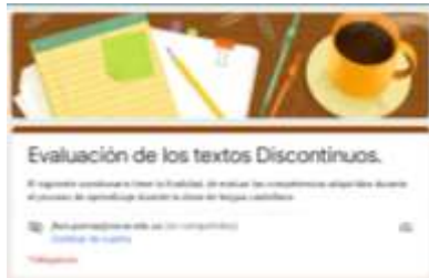
Imagen de la evolución del texto Discontinuo.