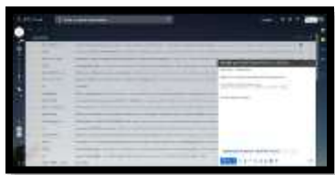
Imagen de la actividad correspondiente para la casa de la herramienta Gmail.com