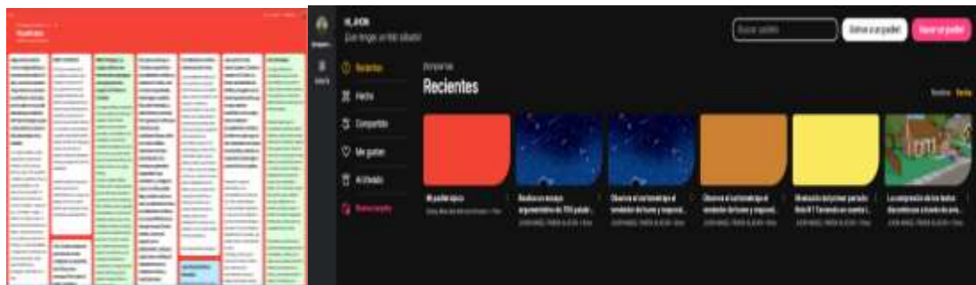
Imagen de la herramienta padlet