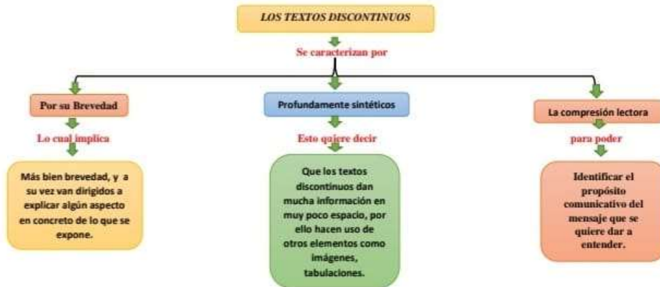
Imagen de mapa conceptual de los textos discontinuo.