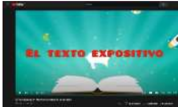
Imagen del video de los textos expositivos

Fuente: elaboración propia. https://www.youtube.com/watch?v=YISXGulJpOA .