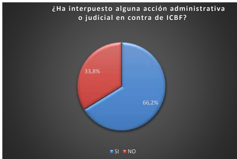
Figura N. 4. Interposición de acciones administrativas o judiciales.