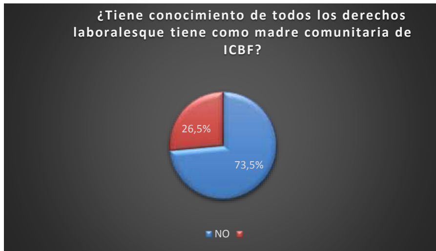
Figura N. 3. Conocimiento de derechos laborales