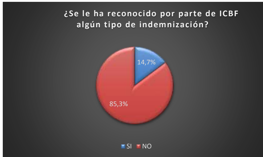
Figura N. 5. Reconocimiento de Indemnización

5. ¿Se le ha reconocido por parte de ICBF algún tipo de indemnización?