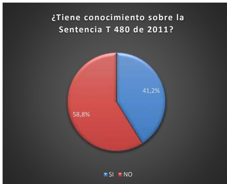
Figura No. 1. Conocimiento de la Sentencia T 480 de 2011