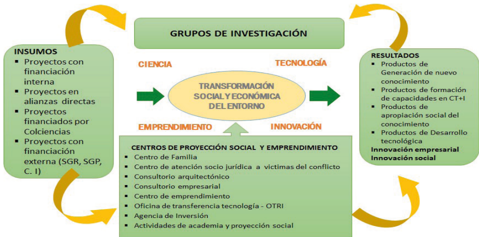
Figura 1. Modelo de Vicerrectoría CTeI – CECAR

Condiciones de calidad para la renovación de registros calificados programas de Administración de Empresas 2019 Vicerrectoría CECAR.