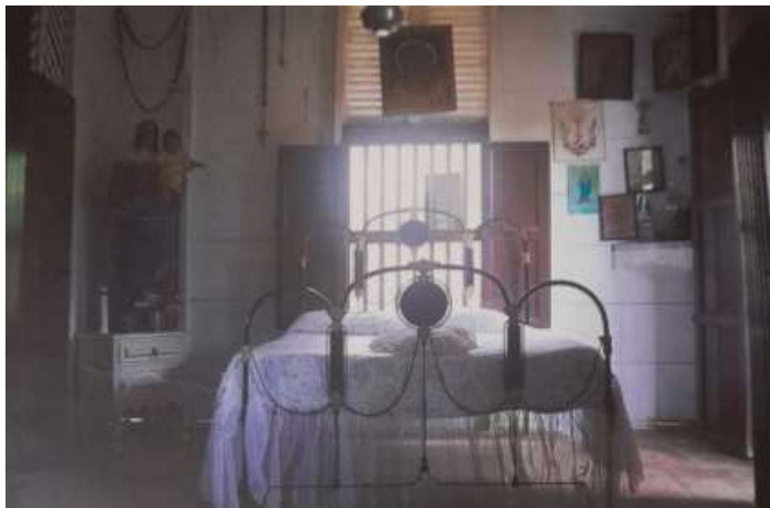
[Fotografía] del interior de la casa (alcoba) ámbito religioso.