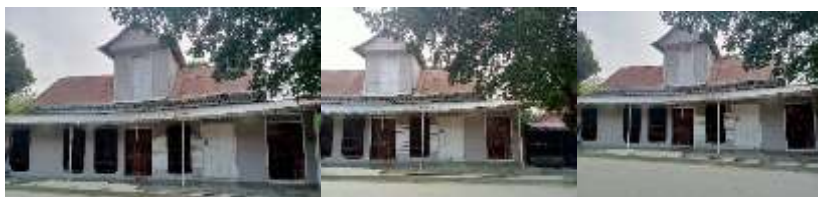
Estado actual de la casa de la niña Rosa, enero 2023 [Fotografía]. Fuente. Autoria Leandro martinez.