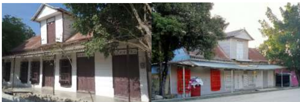
El antes y después de la casa de la niña Rosa.