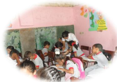
Trabajando en grupo