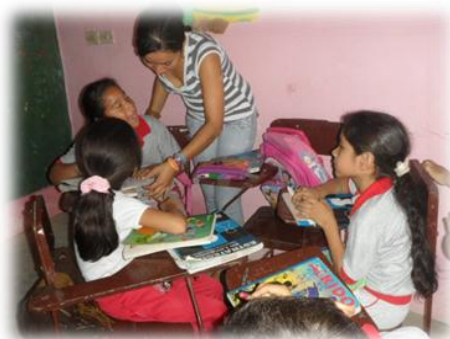
Realizando taller del diptongo