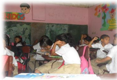
Trabajando las actividades