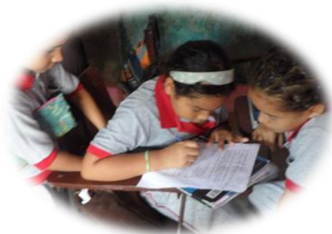
Taller: tema sinónimos y antónimos