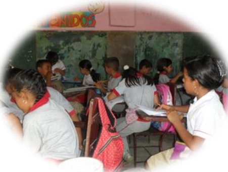
Realizando taller evaluativo