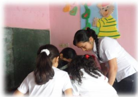
Explicando el taller del adjetivo