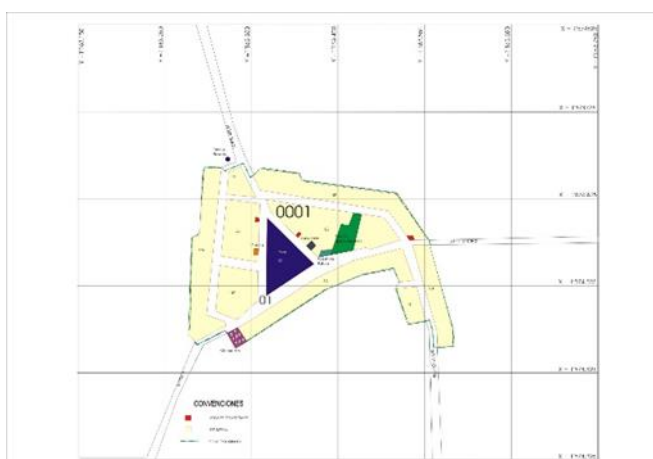
Figura 4. Mapa de Corregimiento del Higuierón

Higuierón es uno de los corregimientos ubicados en el municipio de san Onofre-sucre, el número de habitantes de es de 486 censados y 110 viviendas, solo cuentan con la luz y no tienen alumbrado público ni centro de salud, cocinan con leña, el agua es recolectada de las lluvias o de pozo dulce que nunca se seca, pasa invierno y verano, más sin embargo sus principales actividades económicas son la artesanía con madera y tejido en sepa de plátano o en iraca siendo uno de los mayores ponente en ferias de artesanías de las principales ciudades como Medellín y COLFERIAS en Bogotá, la agricultura muy típico de esa región donde se siembra maíz, plátano ,yuca y ají; y por último la pesca ya que se encuentran cerca de corregimientos de Rincón del Mar y Berrugas donde cuentan con un puerto marítimo del golfo de Morrosquillo.