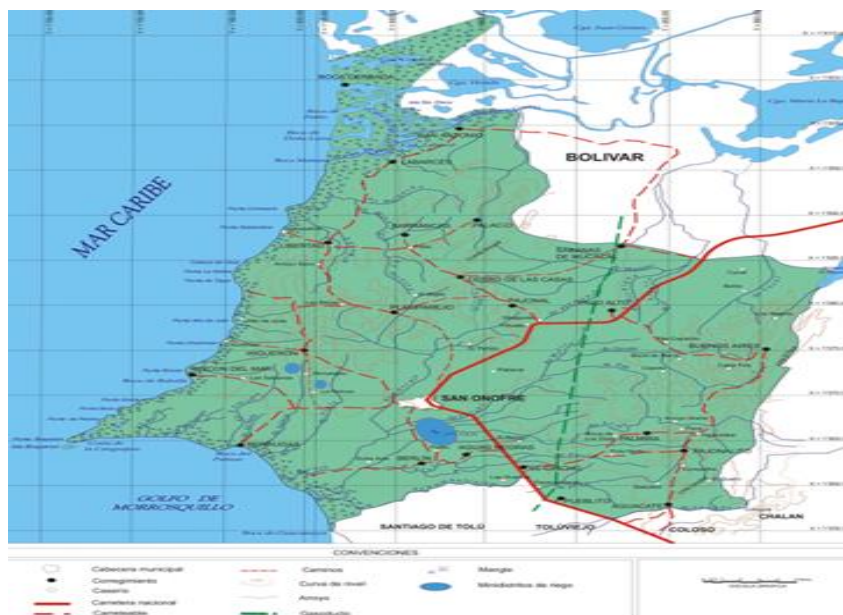
Figura 1. Mapa de Corregimiento de San Onofre.

La Región de los Montes de María, ubicada entre el Río Magdalena, la Serranía de San Jerónimo y el Golfo de Morrosquillo, en los Departamentos de Bolívar y Sucre, se ha hecho visible en las últimas décadas, por las luchas campesinas agrarias y la violencia sociopolítico que atacó a Colombia, en los años 90 aparecieron las FARC y AUC y dió inicio a las acometidas contra la población civil, la cual la convirtieron en una escenario de guerra en donde se cometieron más de 50 masacres.