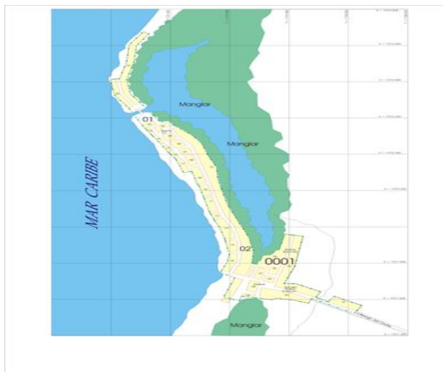
Figura 3. Mapa de Corregimiento de Rincón del Mar.