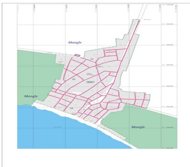
Figura 2. Mapa de Corregimiento de Berrugas.

Berrugas es el hogar de pequeñas familias pesqueras y artesanas. Su Fundación data de más de 100 años. Está ubicado geográficamente en el centro del Golfo Del Morrosquillo. Con entrada terrestre por el departamento de San Onofre, y marítima desde Tolú, Coveñas, el corregimiento es rico en material humano y ambiental, su comercio es basado en la pesca y mariscos. Ha sido seriamente afectado por los malos manejos administrativos y la corrupción del municipio de San Onofre sin dejar a un lado la violencia sociopolítica que se vivió allí, por lo que se encuentra sumergido en un porcentaje significativo de pobreza y un alto índice de necesidades básicas insatisfechas, existe una gran tasa de desempleo a pesar de ser un lugar marítimo, hay poca afluencia de turismo lo que genera un estanco en el desarrollo económico y cultural.