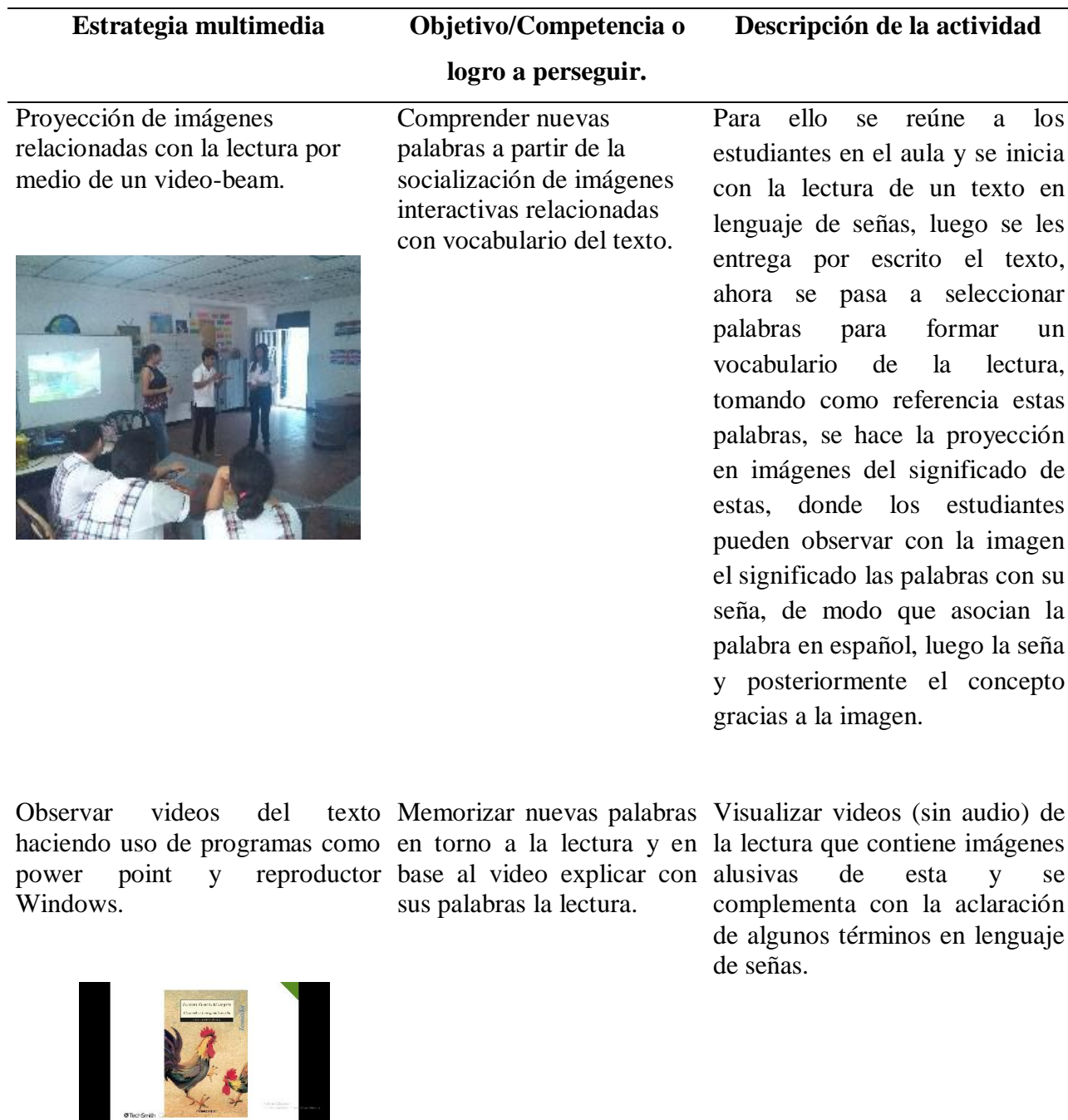
Tabla 1 Propuesta pedagógica