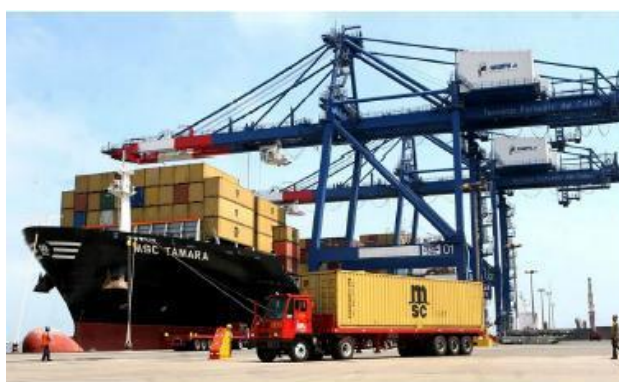
Figura 2. Grúas pórtico

reduce la eficiencia del puerto y hace al mismo tiempo que se pierda atractividad por parte de las navieras (Expósito-Izquierdo, González-Velarde, Melián-Batista, & Marcos Moreno-Vega, 2014). Como solución a este problema aparece la asignación de grúas pórtico, las cuales se encargan de cargar y descargar los grandes buques portacontenedores (ver figura 2), por tanto, se emplean varias grúas simultáneamente para así disminuir los tiempos de operación sobre los buques atracados en muelle (Al-Dhaheri, Jebali, & Diabat, 2016b).