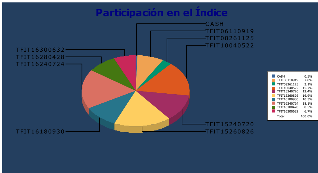
Figura 4. Canasta del Índice COLTES, datos Suministrados por la BVC

Los instrumentos de inversión de renta fija son emisiones de deuda que realiza el estado y las empresas, dirigidas a los participantes del mercado de capitales. Las inversiones en renta fija pueden adquirirse en el instante en que por primera vez se ofrecen al público ó en el momento de la emisión, denominado "mercado primario", o comprarse a otros inversionistas en lo que se conoce como "mercado secundario" Los títulos de Renta fija se negocian en el mercado primario y/o secundario a través del Mercado Electrónico de Colombia, MEC Plus, que comprende el sistema centralizado de operaciones de negociación y registro.